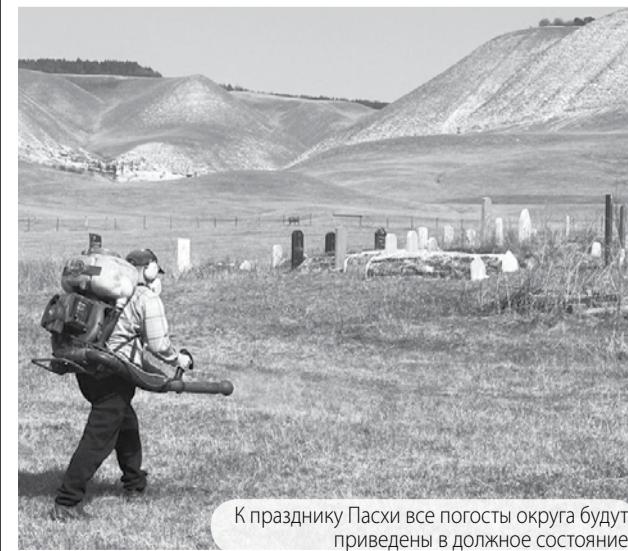
К празднику Пасхи все погосты округа будут приведены в должное состояние.

На данный момент производится акарицидная обработка кладбищ округа, уборка мусора и покос травы. Также на самых крупных кладбищах будут установлены бункеры для сбора отходов.