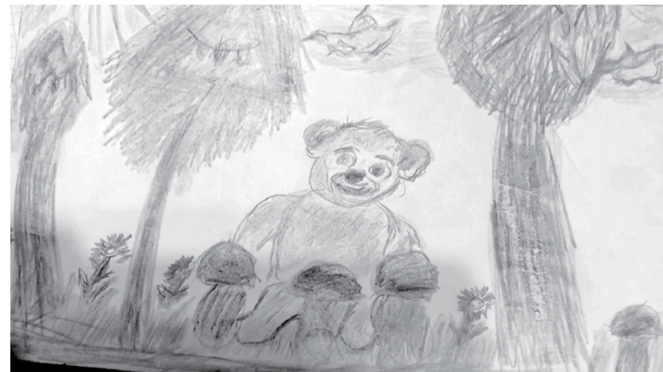
Так внучка иллюстрировала, рассказанный бабушкой случай в горах.

Мы понимали, что по закономерности где-то рядом находится его мать-медведица, а это уже большая опасность для человека, ведь она, защищая своего детёныша, может погнаться за нами и разорвать. Со страху мы со всех ног пустились бежать, не останавливаясь и не огля-