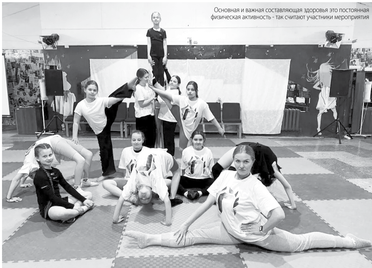
Основная и важная составляющая здоровья это постоянная физическая активность - так считают участники мероприятия