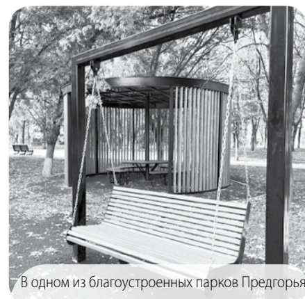
В одном из благоустроенных парков Предгорья

Помимо этого в Предгорном округе в ближайшее время планируется реализация объектов благоустройства в рамках программы местных инициатив.