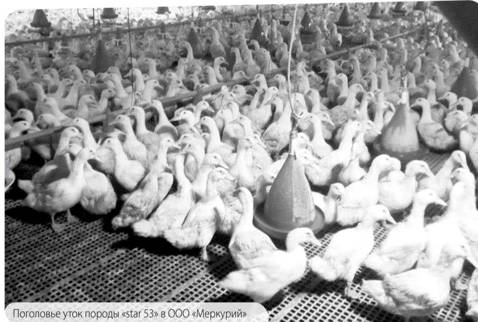
Поголовье уток породы «star 53» в ООО «Меркурий»