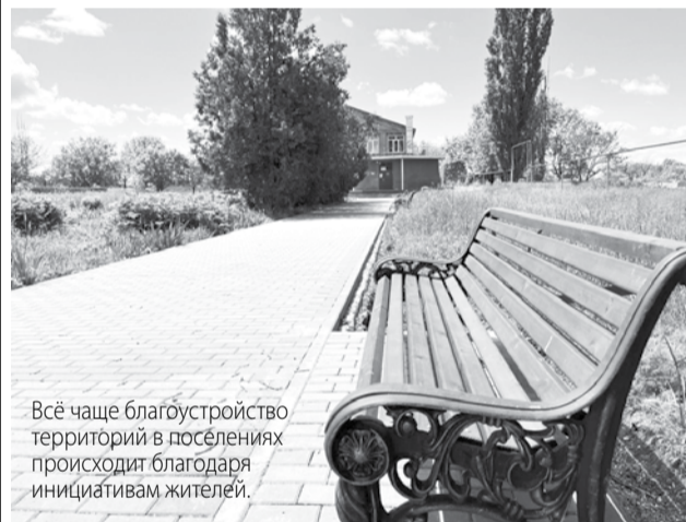
Всё чаще благоустройство территорий в посёлках происходит благодаря инициативам жителей.

В 2024 году реализуют проекты по обустройству тротуаров в сёлах Юца, Новоблагодарное и хуторе Новая Пролетарка, кроме того, в посёлке Мирный планируется обустроить сквер.