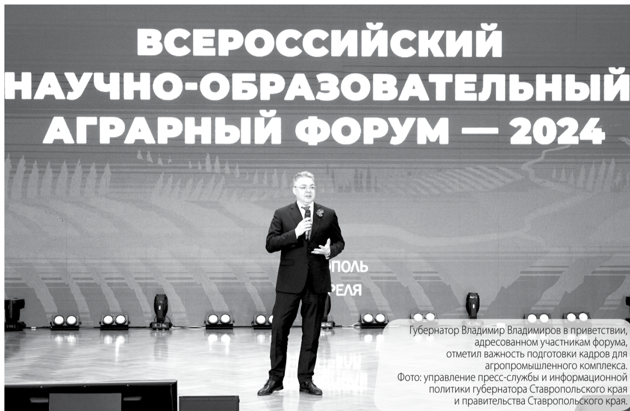
Губернатор Владимир Владимирович в приветствии, адресованном участникам форума, отметил важность подготовки кадров для агропромышленного комплекса.

В РЕГИОНЕ СОСТОЯЛСЯ ВСЕРОССИЙСКИЙ НАУЧНО-ОБРАЗОВАТЕЛЬНЫЙ АГРАРНЫЙ ФОРУМ - 2024