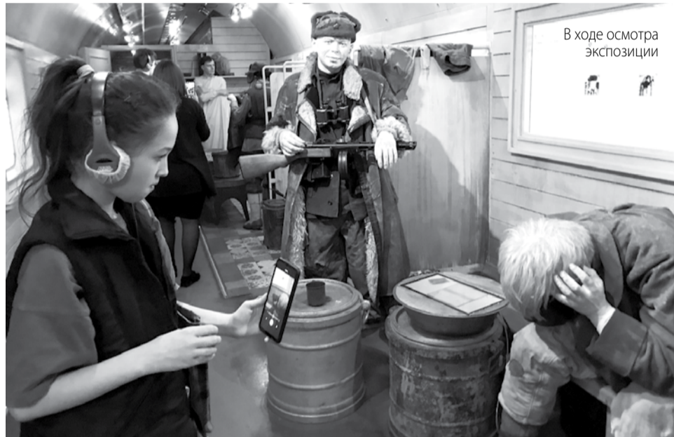
В ходе осмотра экспозиции