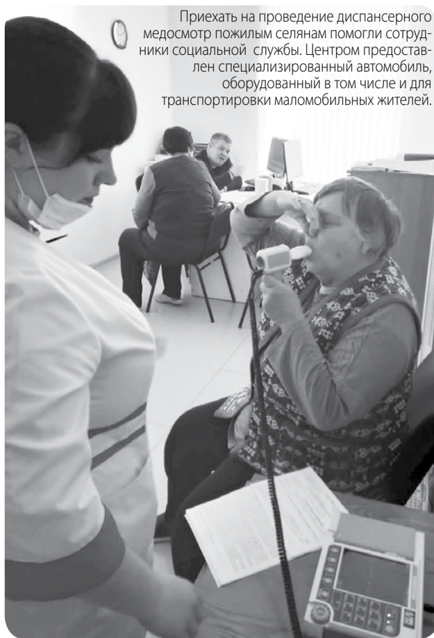
Приехать на проведение диспансерного медосмотра пожилым селянам помогли сотрудники социальной службы. Центром предоставлен специализированный автомобиль, оборудованный в том числе и для транспортировки маломобильных жителей.